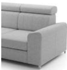
B1 szer. 22 / wys. 49 / gł. 87