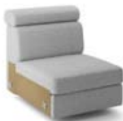
1 (70) 1P (70) pojemnik szer. 70 / wys. 80-90 / gł. 98