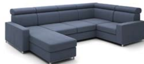
B6+GT1+2 (70)+K1+1 (60)+B6 szer. 323 / wys. 80-90 / gł. 173