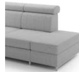
B4 szer. 46 / wys. 41 / gł. 88