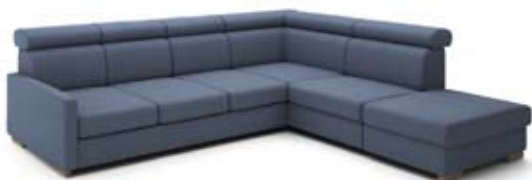
B5+3+GT3+B2 szer. 295 / wys. 80-90 / gł. 235