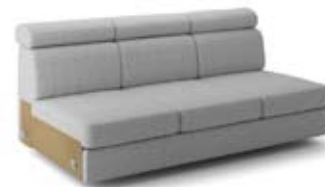
3 (189) 3P (189) pojemnik 3W (189) wózek szer. 189 / wys. 80-90 / gł. 98