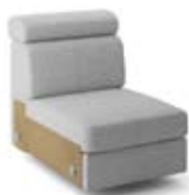
1 (63) 1P (63) pojemnik 1R (63) funkcja relax szer. 63 / wys. 80-90 / gł. 98