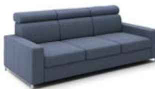
B6+3+B6 szer. 223 / wys. 80-90 / gł. 98