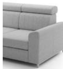
B3 szer. 17 / wys. 49 / gł. 87