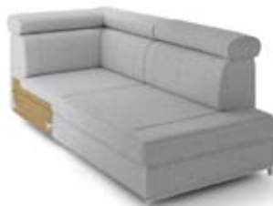
GT2 lewy, pojemnik szer. 95 / wys. 80-90 / gł. 192