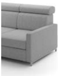
B5 szer. 10 / wys. 49 / gł. 88