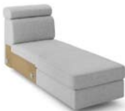
GT1 (63) szer. 63 / wys. 80-90 / gł. 174