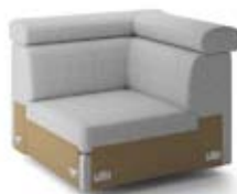
K1 szer. 96 / wys. 80-90 / gł. 96