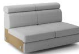
2 (140) 2P (140) pojemnik 2W (140) wózek szer. 140 / wys. 80-90 / gł. 98