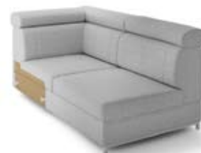
GT3 lewy, pojemnik szer. 95 / wys. 80-90 / gł. 172