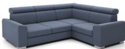
B1+2 (70)+K1+1 (70)+B1 szer. 258 / wys. 80-90 / gł. 188