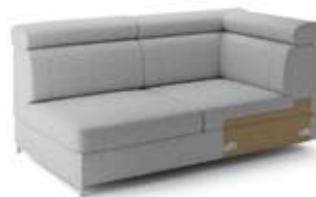
GT3 prawy, pojemnik szer. 95 / wys. 80-90 / gł. 172