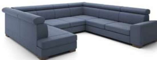
GT2+2 (70)+K1+2 (70)+B1 szer. 331 / wys. 80-90 / gł. 192