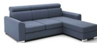
B3+2 (60)+GT1+B3 szer. 230 / wys. 80-90 / gł. 174