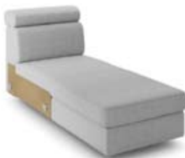
GT1 (70) szer. 70 / wys. 80-90 / gł. 174