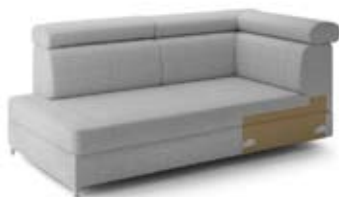
GT2 prawy, pojemnik szer. 95 / wys. 80-90 / gł. 192