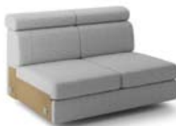
2 (126) 2P (126) pojemnik 2W (126) wózek szer. 126 / wys. 80-90 / gł. 98