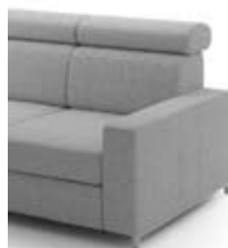
B6 szer. 17 / wys. 49 / gł. 88