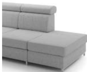
B2 pojemnik szer. 63 / wys. 41 / gł. 88